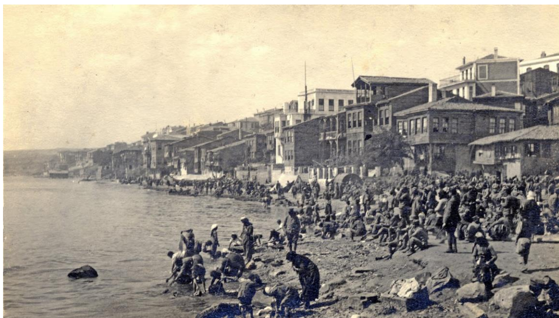
Το Τρίτο Σώμα Στρατού στην παραλία της Ραιδεστού (τέλη Σεπτεμβρίου 1922)