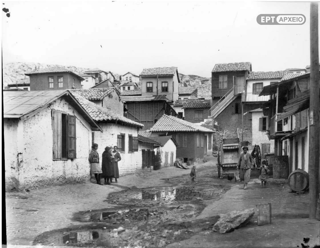
Ο προσφυγικός οικισμός Ταταυλιανά στα Πετράλωνα