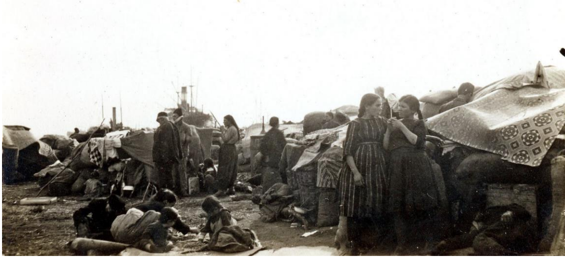
Πρόσφυγες της περιφέρειας Ραιδεστού (αρχές Οκτωβρίου 1922)

Το πρόγραμμα του Διαδικτυακού Διεθνούς Επιστημονικού Συνεδρίου Επανεκτιμώντας τη Μικρασιατική Καταστροφή (1922-2022) σχεδιάστηκε από το Εργαστήριο Λαογραφίας και Κοινωνικής Ανθρωπολογίας του Τμήματος Ιστορίας και Εθνολογίας της Σχολής Κλασικών και Ανθρωπιστικών Σπουδών του Δημοκρίτειου Πανεπιστημίου Θράκης στην Κομοτηνή. Η γραφιστική σχεδίαση του εξωφύλλου και του οπισθοφύλλου πραγματοποιήθηκε από την εταιρεία TWO K Project ΕΠΕ, όπισθεν Οικισμού Ηφαίστου, έναντι Πανεπιστημιούπολης, 69150 Κομοτηνή.